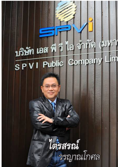
จากการใช้อุปกรณ์เพื่อการเรียนรู้ที่บ้านในช่วงการแพร่ระบาดโควิด-19 บริษัทจึงเตรียมขยายสาขาใหม่อีก 7 แห่งในสถาบันการศึกษา

นอกจากนี้ บริษัทเห็นช่องทางจำหน่ายสินค้าให้กับกลุ่มนักศึกษาเพิ่มมากขึ้น